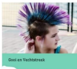
Gooi en Vechtstreek